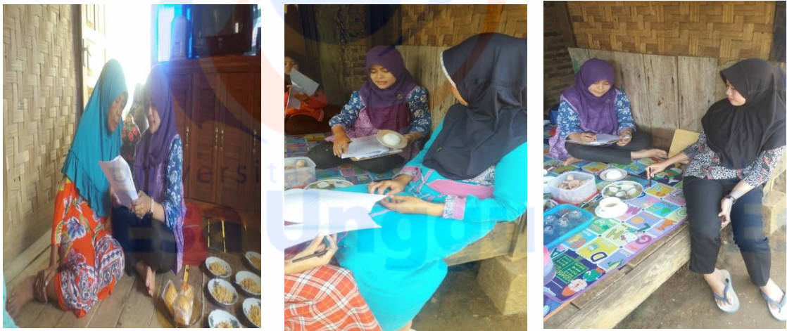
Pengisian dan Pembacaan Kuesioner Pengetahuan dan Sikap