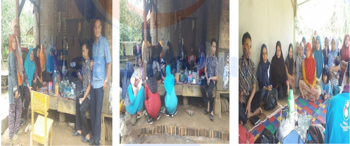
Perkenalan dengan Responden dan Penyampaian Maksud Tujuan