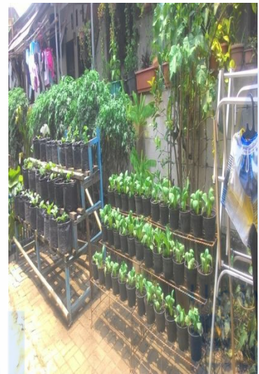
Contoh Pemanfaatan Pekarangan ( KRPL ) dan Hasil Tanaman Pekarangan